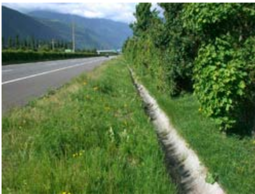
Bild 1: Die bestehenden betonierten Entwässerungsgräben entlang der A9 werden zurückgebaut

Im Kanton Wallis werden neue Modelle der Entwässerung getestet und realisiert: Auf diversen offenen Strecken der A9 (Pfywald – Leuk – Gampel – Visp) sowie auf der Strecke zwischen Bex und Martigny soll die A9 künftig «über die Schulter» entwässert werden. Die bestehenden Entwässerungsgräben aus Beton längs der A9 werden renaturiert und durch bepflanzte, flache Erdmulden ersetzt.