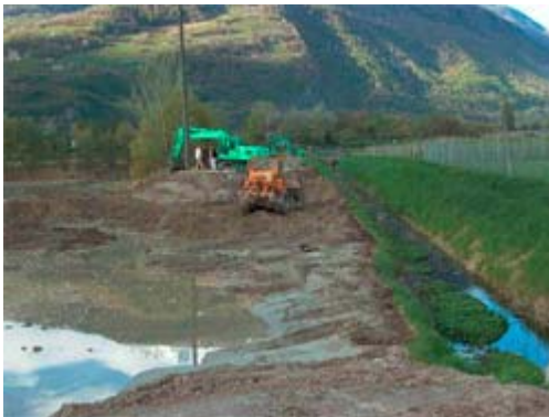
Bild 2: Entwässerung nach dem neuen Modell: Flache Erdmulden dienen künftig als natürliche Filter für das Abwasser der A9.